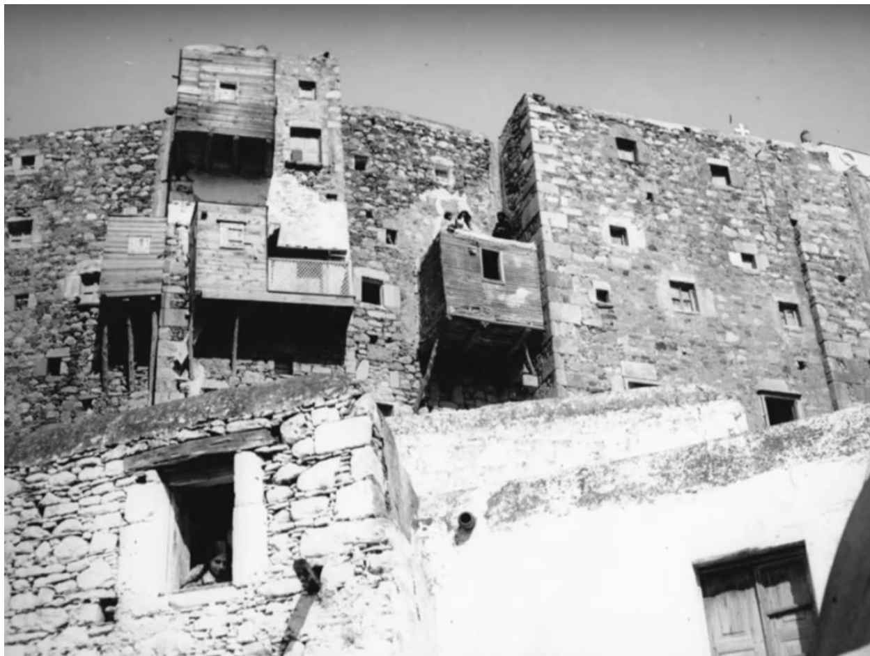
Κατοικίες εντός και γύρω από το κάστρο, Χώρα Αστυπάλαιας