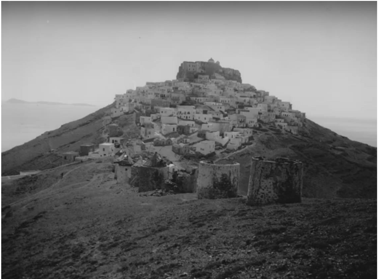
Χώρα Αστυπάλαιας, αρχές 20 ου αιώνα.